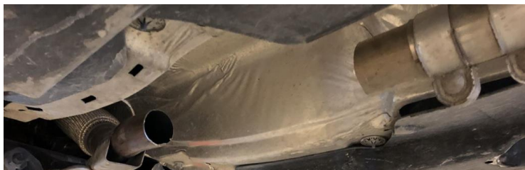
Larmtjänst april 2021